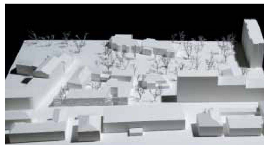
4. Rang: Buchner Bründler, Basel und ARCH 4 AG, Moskau