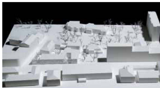
4. Rang: Buchner Bründler, Basel und ARCH 4 AG, Moskau