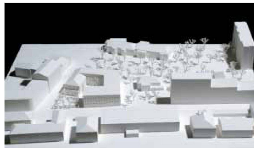
5. Rang: ARGE Grazioli / Krischanitz, Zürich