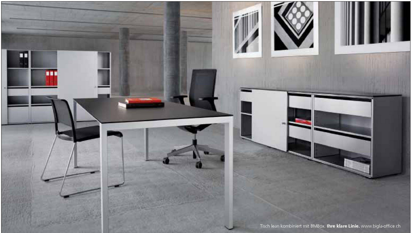
Tisch lean kombiniert mit BMBox. Ihre klare Linie. www.bigla-office.ch