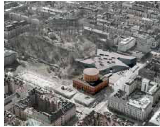
4. Preis, ex aequo: «Blanket», Stephen Taylor Architects, London

durch wächst die Gefahr, dass die Entscheidungen am Ende unter zeitlichem Druck überstürzt werden.