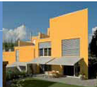
Hartmann bietet Lebensqualität: Sonne- und Wetterschutz