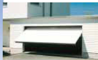
Hartmann öffnet Ihnen Tür und Tor: automatische Garagentore