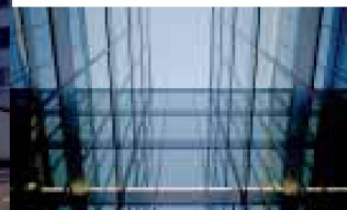
Hartmann setzt visionäre Architektur um: Fassadenbau Hartmann ist immer für Sie da: auch bei Service und Reparaturen