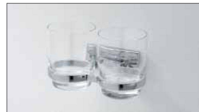
Das neue, noch einmal reduzierte Design der Accessoires-Serie CHIC von Bodenschatz. Jetzt erhältlich!

Wer die Bäder von Mietwohnungen mit CHIC ausstattet, ist auf der sicheren Seite: Die Kombination «günstiger Preis für langlebige und schöne Accessoires» findet bei der Bauherrschaft ebenso Gefallen wie bei den Mieterinnen und Mietern. Sicherheit verspricht auch die Nachliefergarantie für neue und für bisherige Modelle. Umfassende Informationen zu CHIC sind erhältlich bei der Bodenschatz AG.