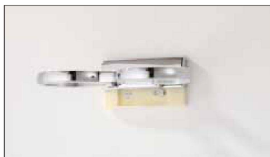
Der Flansch wird an der Wand befestigt, die Accessoires werden ganz einfach darüber geschoben.