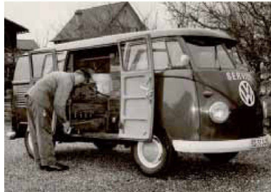
Zeitsprünge: Als dieses Sanitärservice-Auto zum Einsatz kam, war CHIC von Bodenschatz bereits 10-jährig (Bild Schenk-Bruhlin, Sargans 1967)

Die innovative Idee der indirekten Befestigung war es nicht alleine, was den 50-jährigen Siegeszug der Accessoires-Serie CHIC von Bodenschatz möglich gemacht hat. CHIC hat ein schlichtes, reduziertes Design, das weder Modeströmungen noch Stilempfindungen unterworfen ist. Die Serie umfasst alle Accessoires-Produkte, welche für eine funktionale Einrichtung eines Badezimmers benötigt werden, vom Zahnglas über den Seifenspender bis hin zum Papierrollenhalter und der WC-Garnitur.