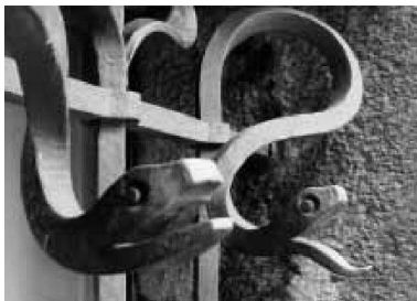
Oben: Lichthof als Sockelbau des Amtshauses III an der Strassenrampe. Unten: Kellerwächter am Amtshaus III