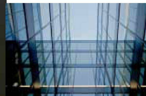
Hartmann setzt visionäre Architektur um: Fassadenbau