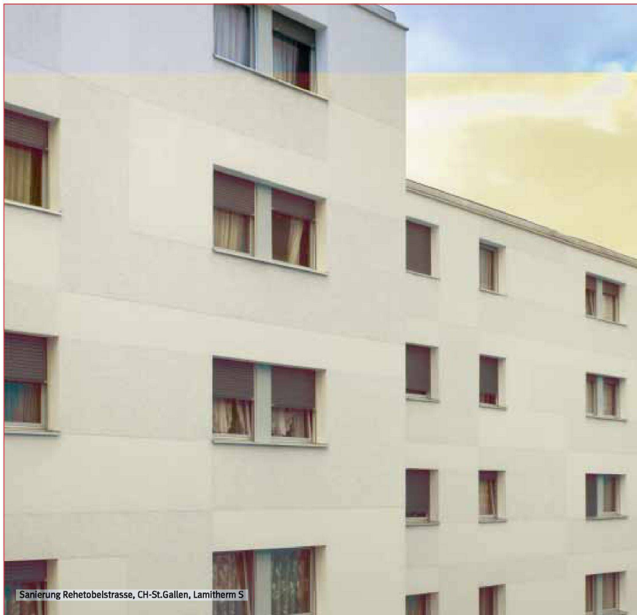
Sanierung Rehetobelstrasse, CH-St.Gallen, Lamitherm S