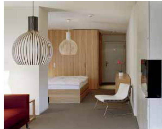
Blick in eine von Buchner Bründler Architekten umgebaute Suite

zapfen erinnern. Das Licht in der Lounge ist gedämpft und die Stimmung elegant gemütlich.