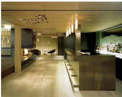
Die neu geschaffene Gastrozone mit fließenden Grundrissen. Im Vordergrund die Bar aus brüniertem Messing