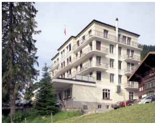
Das Parkhotel Bellevue in Adelboden wurde 1931 von Urfer & Stähli erbaut.

In Adelboden, gleich oberhalb des Dorfkerns, befindet sich das Parkhotel Bellevue. Es ist von unten kaum sichtbar, da Gewerbe- und Wohnbauten im Chaletstil es verdecken. Ist man nach einer kurzen Steigung beim Hotel angelangt, geniesst man eine wunderbare Sicht auf das südliche Bergpanorama mit dem Hausberg Wildstrubel – der Name des Hotels hält, was er verspricht. Das Haupthaus des Hotels wurde 1931 von den beiden Interlakner Architekten Urfer & Stähli im Stil der Moderne gebaut: ein schnörkelloser, weiss verputzter Steinbau mit schmalen, umlaufenden Balkonen. Über die Jahrzehnte kamen im Westen ein zusätzlicher Trakt für Zimmer und ein weiterer für den Wellnessbereich hinzu.