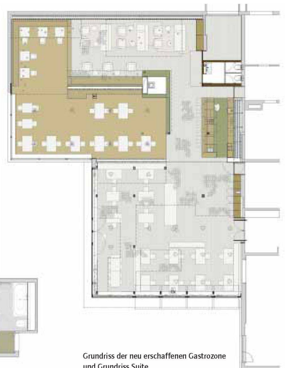
Grundriss der neu erschaffenen Gastrozone und Grundriss Suite