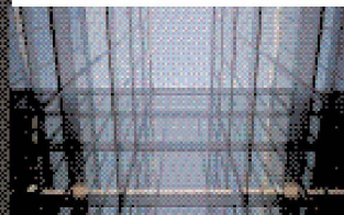
Hartmann setzt visionäre Architektur um: Fassadenbau Hartmann ist immer für Sie da: auch bei Service und Reparaturen