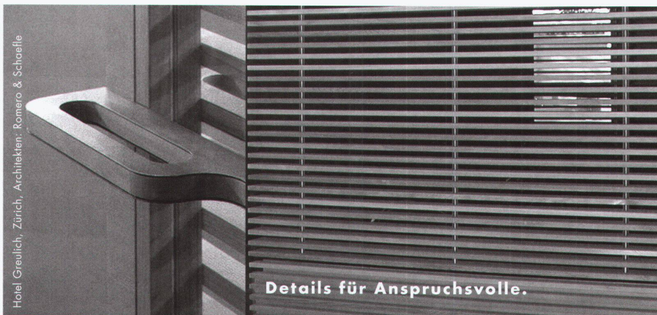
Hotel Greulich, Zürich, Architekten: Romero & Schaeffle

Übersetzung: Suzanne Leu, texte original: www.werkbauenundwohnen.ch