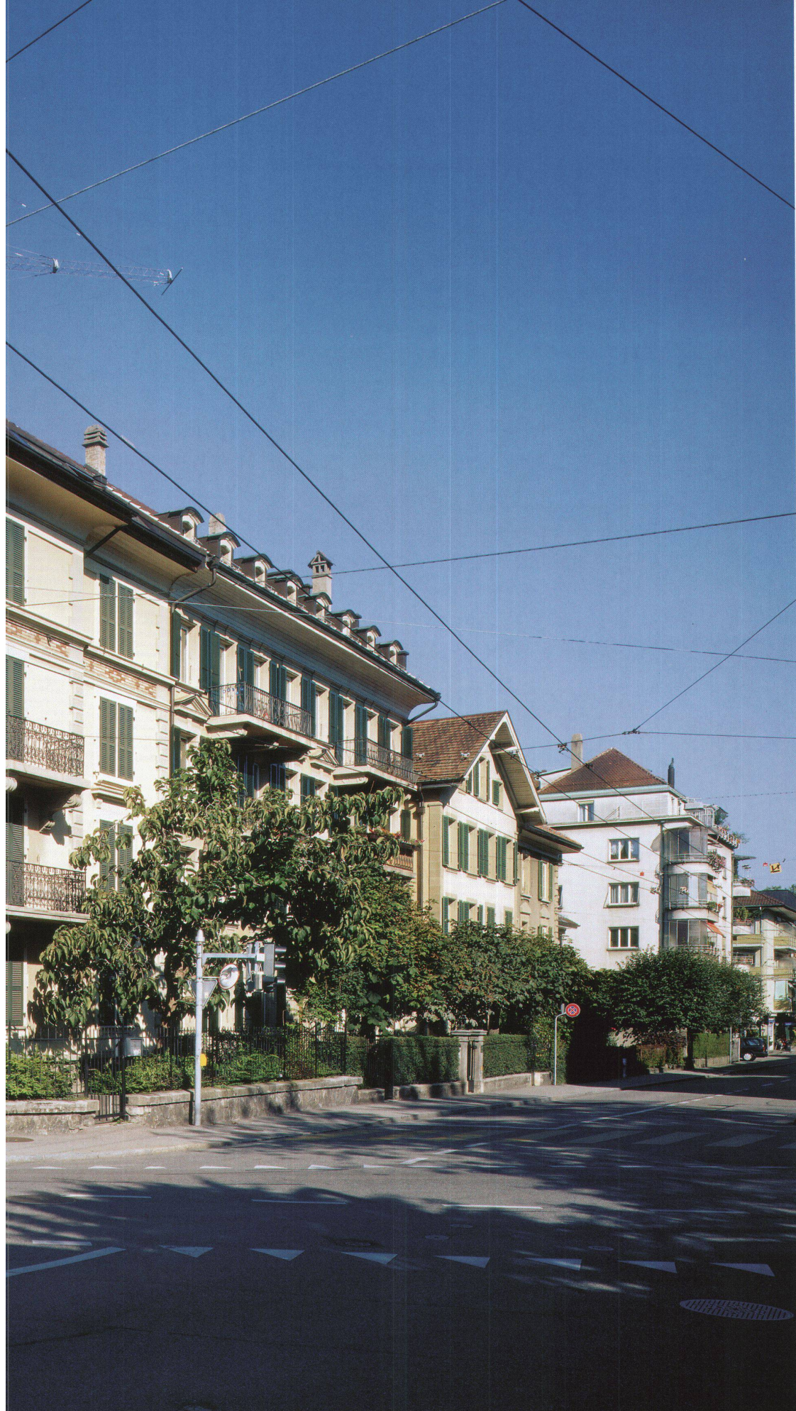
Nigerianische Botschaft, Bern