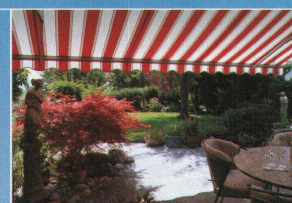
Hartmann bietet Lebensqualität: Sonnen- und Wetterschutz