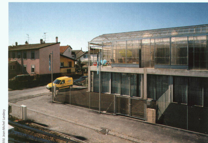
Cité Manifeste in Mulhouse von A. Lacaton und J.-P. Vassal