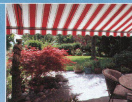
Hartmann bietet Lebensquali- tät Sonnen- und Wetterschutz