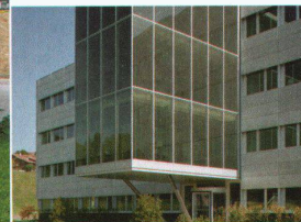
Hartmann setzt visionäre Architektur um