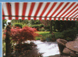
Hartmann bietet Lebensqualität Sonnen- und Wetterschutz