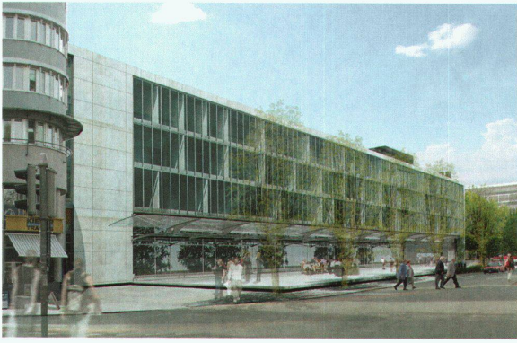
2. Rang: Büro B, Architekten und Planer AG, Bern