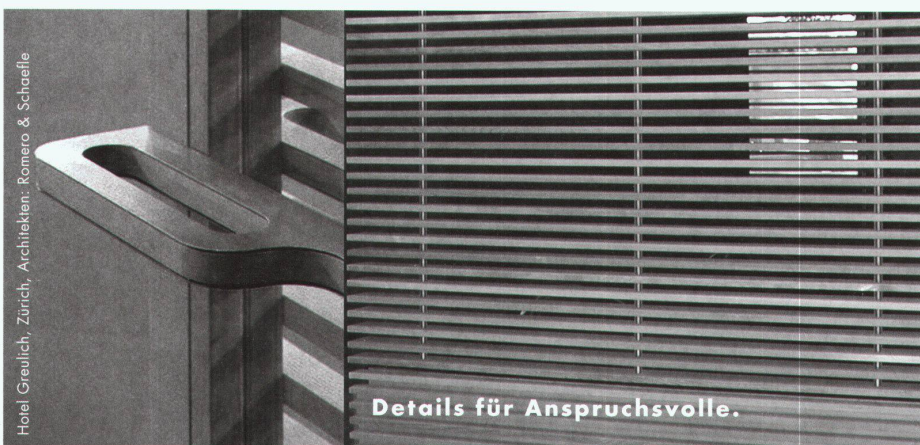
Hotel Greulich, Zürich, Architekten: Romero & Schaeffle

Der Beurteilung wurde ein umfassender Kriterienkatalog zugrunde gelegt, welcher sich allerdings bei der Preisurteilung nicht schlüssig ablesen lässt. So muss gerade bei den Kriterien Funktionalität/Nutzung, die im Katalog an erster Stelle geführt werden, bei gewissen prämierten Projekten ein grosses Fragezeichen angebracht werden. Insbesondere das Projekt im dritten Rang der Architektengemeinschaft Lischer Partner und Degelo, Luzern, weist eine Konzeption auf, die sich eher mit einem Neubauprojekt realisieren liesse. Denn in der Auseinandersetzung mit der bestehenden Gebäudestruktur und den mög-