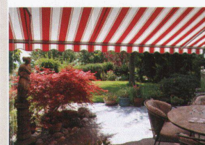
Hartmann bietet Lebensqualität Sonnen- und Wetterschutz