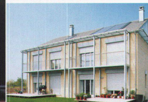
Hartmann setzt visionäre Architektur um