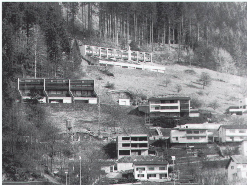
Hangsiedlung «Halde» in Bludenz, Hans Purin, 1966