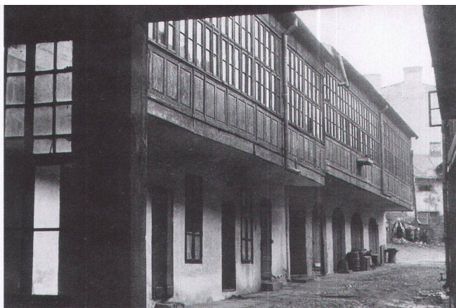
4 Haus in Bukarest, gebaut Anfang des 17. Jahrhunderts, umgebaut um 1855

derselben – die Fassade löst sich als Ganzes in mehrere Ebenen auf. Bedingt durch die räumliche Staffelung der verschiedenen Materialschichten entsteht eine klimatische Pufferzone. Die vorgelagerte Glashülle fängt im Winter das in flachem Winkel einstrahlende Sonnenlicht ein, sodass sich die dahinter liegende Luft erwärmt. Die Brüstungen, wenn nicht verglast, sind aus dunklen Holzbrettern oder dünnen Blechtafeln, welche die Sonnenwärme sofort nach innen leiten. Im Sommer, wenn die Sonne steil am Himmel steht, bildet das vorspringende Dach einen Schutz vor übermässiger Erwärmung. Die vordere Verglasung wird dann ganz oder teilweise entfernt, oder die oberen Fensterflügel sorgen für eine ausreichende Belüftung. Weisse Tücher oder weisse Papiere, an der Innenseite der Glasscheiben angebracht, weisen die Sonnenstrahlen ab und verschatten Teile der Hauswand (Abb. 3). So vermag sich die verglaste Zwischenschicht ener-