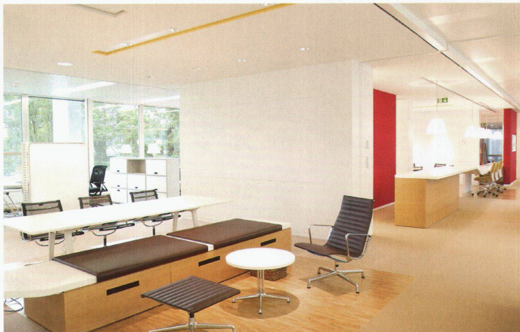
Plan und Bild: Novartis-Gelände Basel, Gebäude WSJ 202.3

Sevil Peach, geboren 1949 in der Türkei, studierte Interior Design an der Universität von Brighton. Nach Mitarbeit in verschiedenen Architektur- und Designbüros in London und Istanbul gründete sie 1994 zusammen mit Gary Turnbull ihr eigenes Studio Sevil Peach Gence Associates SPGA. Das Studio gestaltete unter anderem die Büros der Vitra GmbH in Weil am Rhein (1998), das Hauptquartier von MEXX in Amsterdam (2003) oder ein Pilotprojekt für neue Arbeitswelten für Novartis in Basel (2003).