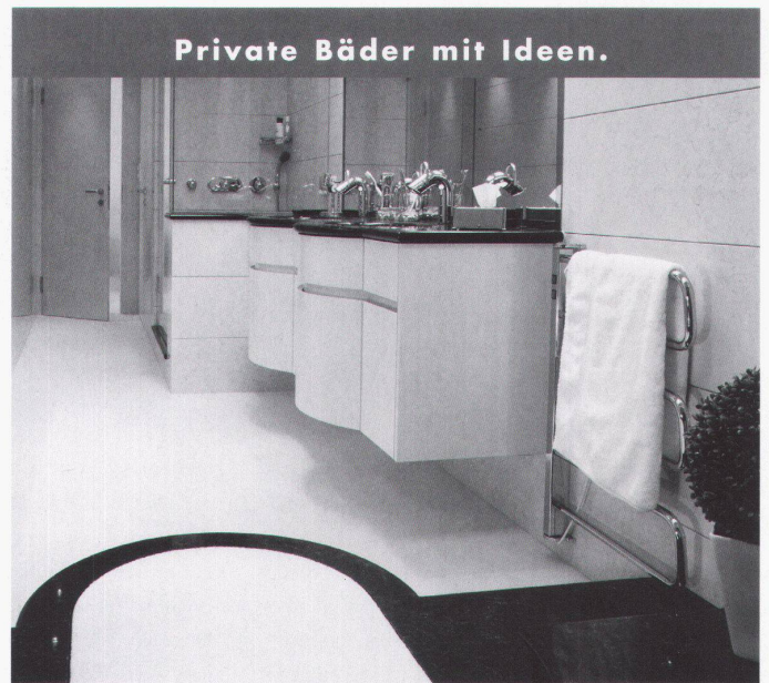
Private Bäder mit Ideen.