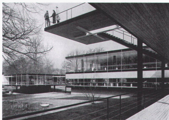
Deutscher Pavillon in Brüssel, 1958