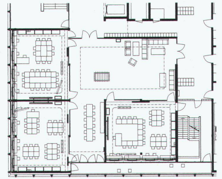
3 Schulhaus Im Birch (2000–04) in Zürich von Peter Märkli, Zürich. Raumcluster, Grundriss

Lehrern und Lehrerinnen unterstützt werden. Letztere erarbeiten mit den Schülern regelmässige persönliche Lernprogramme mit klar definierten Zielen. Auch in der Schweiz finden sich bereits zahlreiche Schulbauten, die nicht länger primär durch «klassische» Schulzimmer charakterisiert werden, sondern vermehrt Raumgruppen oder Raumzonen aufweisen, die von stets wechselnden Schülergruppen genutzt werden. Neben In der Höhe sei exemplarisch die Zurich International School (1999–2002) in Wädenswil von Galli & Rudolf genannt (werk, bauen + wohnen 1-2|2003, S. 50–55), das Projekt für die Schulanlage Herti in Zug (Wettbewerb 2002) von Enzmann & Fischer oder natürlich das Schulhaus im Birch in Zürich von Peter Märkli, das diesen Herbst in Betrieb genommen wurde (vgl. in dieser Nummer S. 14–23).