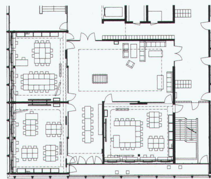
3 Schulhaus Im Birch (2000–04) in Zürich von Peter Märkli, Zürich. Raumcluster, Grundriss

Lehrern und Lehrerinnen unterstützt werden. Letztere erarbeiten mit den Schülern regelmässig persönliche Lernprogramme mit klar definierten Zielen. Auch in der Schweiz finden sich bereits zahlreiche Schulbauten, die nicht länger primär durch «klassische» Schulzimmer charakterisiert werden, sondern vermehrt Raumgruppen oder Raumzonen aufweisen, die von stets wechselnden Schülergruppen genutzt werden. Neben In der Höhe sei exemplarisch die Zurich International School (1999–2002) in Wädenswil von Galli & Rudolf genannt (werk, bauen + wohnen 1-2| 2003, S. 50–55), das Projekt für die Schulanlage Herti in Zug (Wettbewerb 2002) von Enzmann & Fischer oder natürlich das Schulhaus im Birch in Zürich von Peter Märkli, das diesen Herbst in Betrieb genommen wurde (vgl. in dieser Nummer S. 14–23).