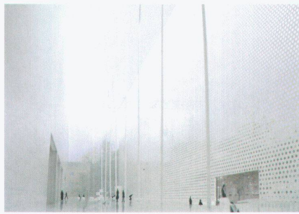
SANAA (Kazuyo Sejima + Ryue Nishizawa): Institut València d'Art Modern (2004–2007), Rendering des Foyers der Erweiterung

Dichte. Er sucht dabei den direkten Bezug zum meisterhaften Museumsambau von Carlo Scarpa (1956–64) und zu seinen eigenen Arbeiten. An- dern Projekten fehlen solche Bezugsebenen zum Ort und eine vergleichbare intellektuelle Tiefe.