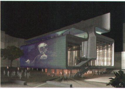
Foreign Office Architects: BBC White City, Music Centre und Büros in London (2003), Rendering der Aussenansicht