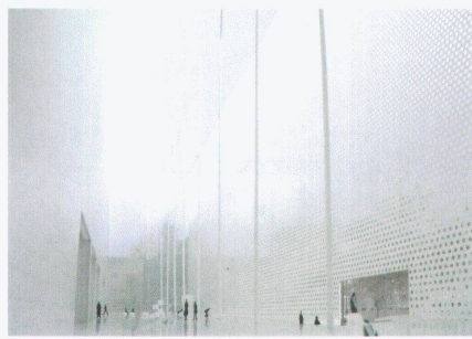
SANAA (Kazuyo Sejima + Ryue Nishizawa): Institut Valencià d'Art Modern (2004–2007), Rendering des Foyers der Erweiterung

Dichte. Er sucht dabei den direkten Bezug zum meisterhaften Museumsbau von Carlo Scarpa (1956–64) und zu seinen eigenen Arbeiten. An- dern Projekten fehlen solche Bezugsebenen zum Ort und eine vergleichbare intellektuelle Tiefe.