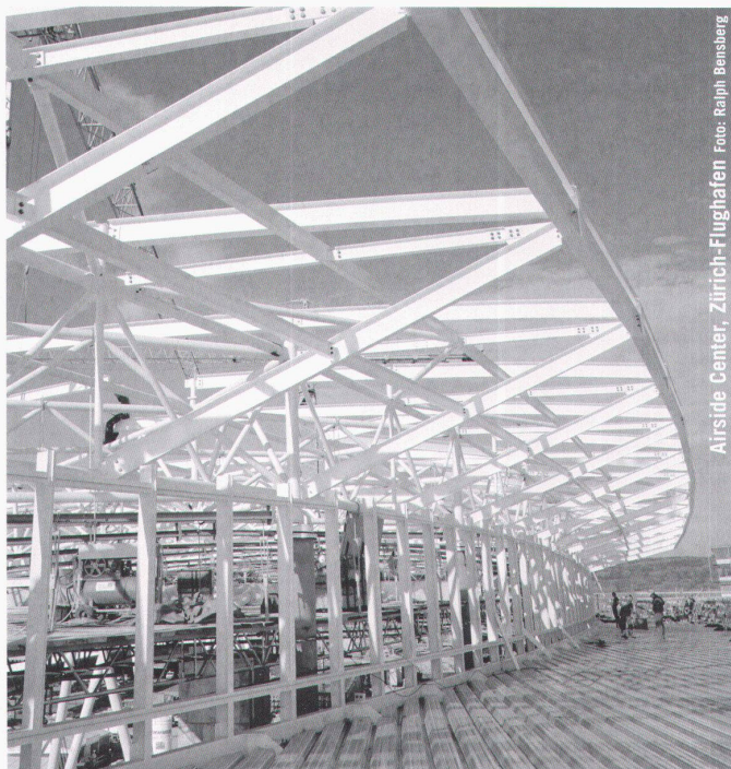
Airstile Center, Zürich-Flughafen

Partner für anspruchsvolle Projekte in Stahl und Glas