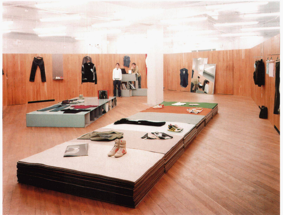
1. Preis Shop: 6A Architects, London

Von einem Innenarchitektur-Wettbewerb dürfte man punkto Präsentation mehr erwarten, als in Hannover geboten wurde. Unbestritten ist, dass das Durcheinander von Ausstellung und Messe zu einem uneinheitlichen und damit wenig einladenden Gesamtbild beitrug. Die klare räumliche und gestalterische Trennung von Contractworld