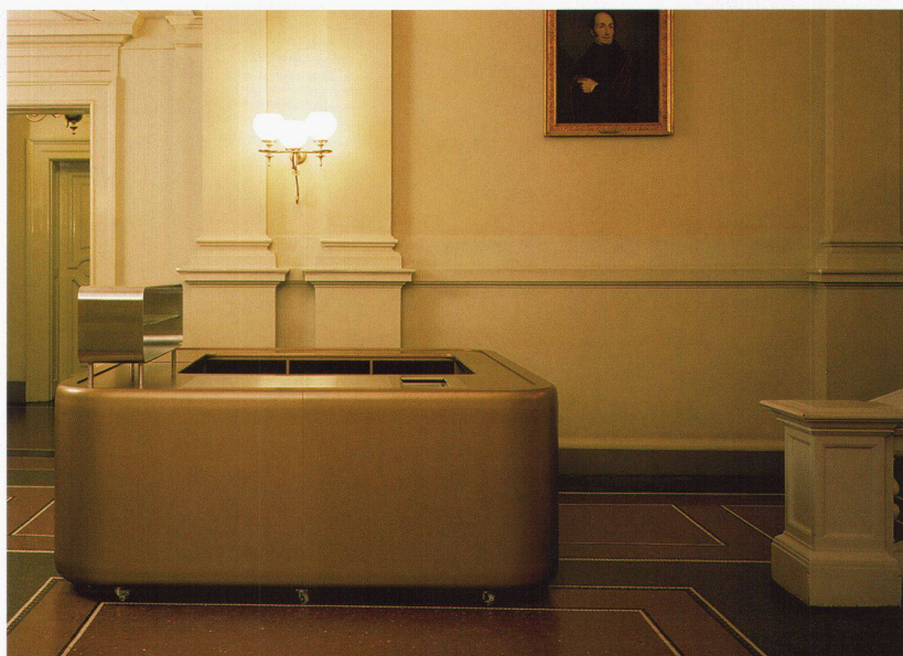
1. Preis Hotel: BEHF Architekturbüro, Wien 3. Preis Hotel: Architekturbüro Knerer + Lang, Dresden