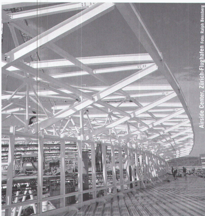
Airside Center, Zürich-Flughafen

Partner für anspruchsvolle Projekte in Stahl und Glas