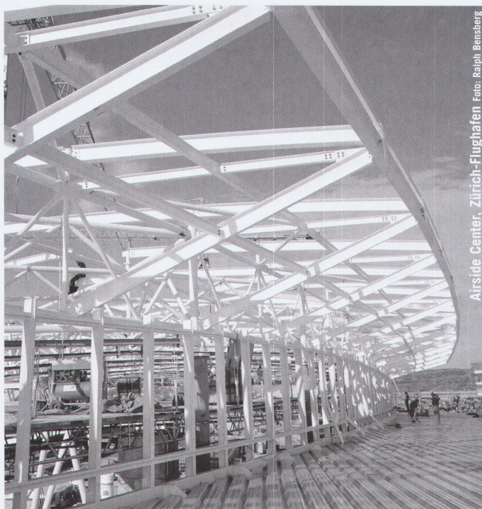
Airside Center, Zürich-Flughafen

Partner für anspruchsvolle Projekte in Stahl und Glas