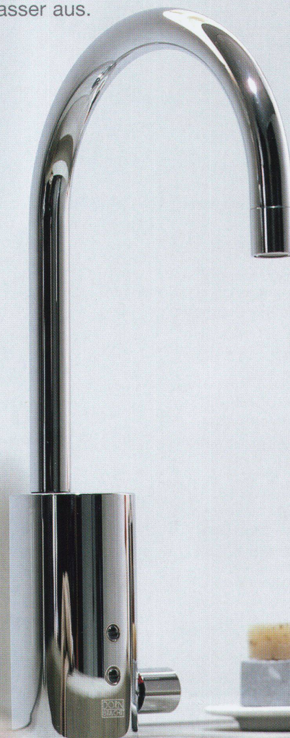
Meiré und Meiré

Hand hin, Wasser an. Hand weg, Wasser aus.