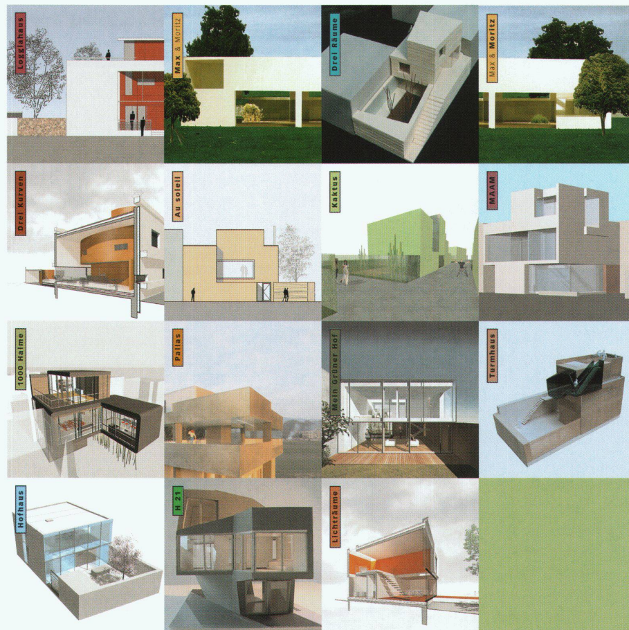
Siedlung Stegbünt: 15 Hausentwürfe von 14 jungen Architekturbüros

Dabei ist zunächst mal viel Erfreuliches am Vorhaben auszumachen. Die Projektentwickler, Belvedere Architekten (Bremgarten BE), regte die Konzeption einer Siedlung an, in deren Rahmen junge, profilierte Architektinnen und Architekten ihre Vorstellungen vom «Wohnen im 21. Jahrhundert» verwirklichen sollten. Tatsächlich finden sich unter den Beteiligten zahlreiche, welche längst mit prononcierten Wettbewerbsbeiträgen auf sich aufmerksam gemacht haben, aber noch kaum oder wenig haben umsetzen können. Die wenigen vergleichbaren Siedlungsprojekte setzen auf die Anziehungskraft etablierter Namen, so in der Beton-Musterhaus-Siedlung am Wiener Stadtrand (unter Leitung von Adolf Krischanitz, s.werk, bauen + wohnen 1/2-03, S.68f), oder in der Planung gebliebenen Siedlung Melchrüti in Zürich-Wallisellen (geplant 1996–97, schliesslich aus einer Hand entworfen und gebaut). Und es ist zunächst einmal ver-