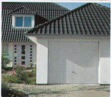
Berry Kipptore: Stahl oder Holz in 20 schönen Motiven