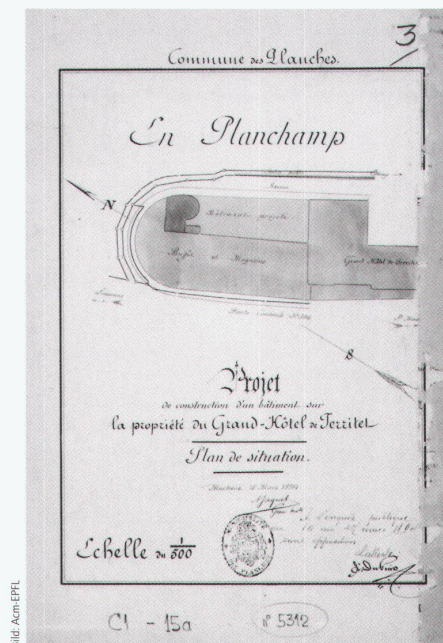
Situationsplan des Festsaals für das «Grand Hôtel» in Territet, von Marcel Chollet und Eugène Jost, 1894-95.

beiden Nachbarn des Archivio, das gta in Zürich und das AcM in Lausanne, ausführlich zu Wort kommen, zeugt vom guten Klima, das in diesem Kreis gemeinsamer Interessen herrscht. Man baut offensichtlich nicht auf Konkurrenz sondern auf Ergänzung und Zusammenarbeit – ein gutes Omen für die Zukunft.