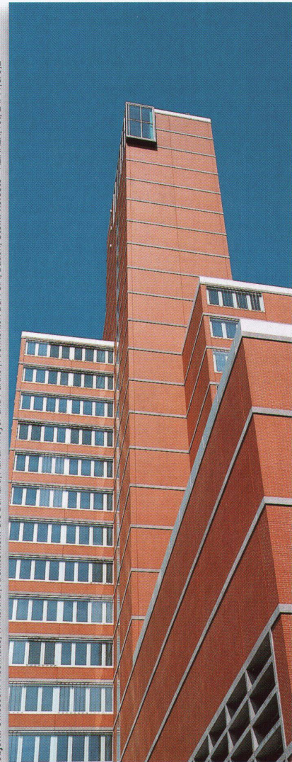
Objekt: Swisscom-Hochhaus, Winterthur, Architekten: Urs Burkard, Adrian Meyer und Partner, Architekten BSA SIA, Baden, Stein: kelesto®-KLINKER, rot, 24/11,5/5,2