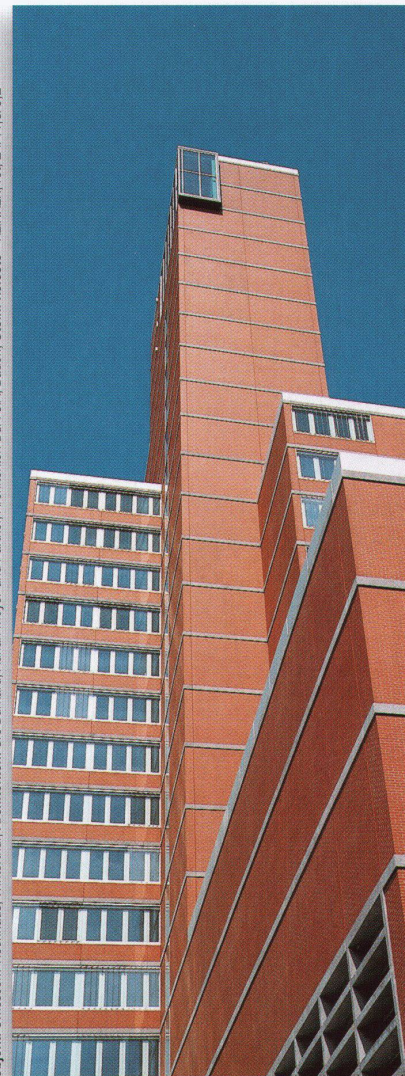
Objekt: Swisscom-Hochhaus, Winterthur, Architekten: Urs Burkard, Adrian Meyer und Partner, Architekten BSA SIA, Baden, Stein: kelesto®-KLINKER, rot, 24/11,5/5,2