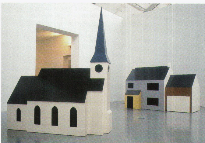
«You see a Church» und «You pass a House», Julian Opie, Ausstellung: HausSchau – Das Haus in der Kunst, Deichtorhallen Hamburg