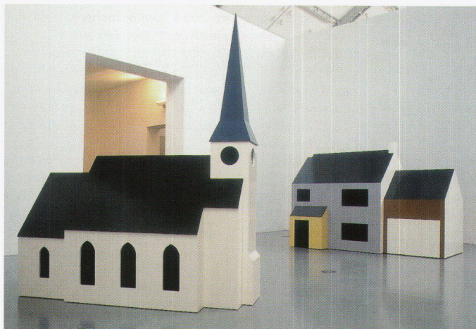
«You see a Church» und «You pass a House», Julian Opie, Ausstellung: HausSchau – Das Haus in der Kunst, Deichtorhallen Hamburg