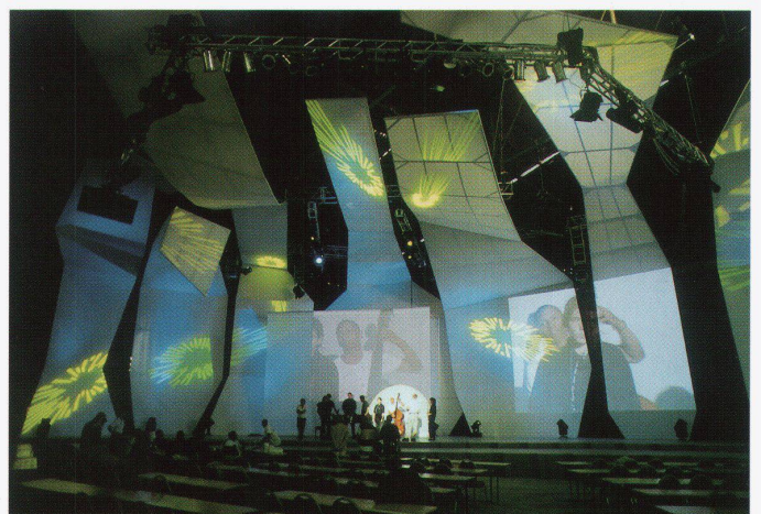
«Spurendenken», SHE_arch, Hamburg