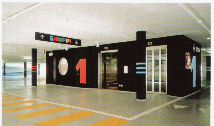
Gedekte Fussgängerpassage zwischen Parkhaus und Shoppingcenter (links)