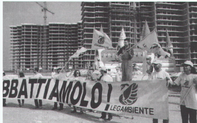
Protestkundgebung gegen die Überbauung in Punta Perotti, Bari

Leonardo Benevolo hat Renzo Piano im «Corriere della Sera» vorgehalten, dass er «Dinge entwerfe, die seines Talentes unwürdig seien». Als Beispiele führt er den Kansai Airport in Osaka an, dessen künstliche Insel sich beträchtlich gesenkt hat, und die Wohnüberbauung von Punta Perotti in Bari, einem am Meer gelegenen «Monster» von 300 000 m 3 .