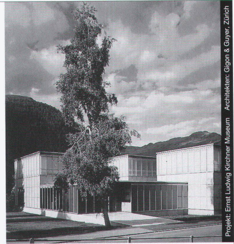
Projekt: Ernst Ludwig Kirchner Museum Architekten: Gilson & Guyer, Zürich

Ästhetik, Wirtschaftlichkeit und bauphysikalische Anforderungen in Einklang zu bringen, ist das Ergebnis ausgereifter Konstruktionen. Qualitätsbewusstsein und partnerschaftliche Zusammenarbeit sind nur einige der Voraussetzungen für ein gutes Gelingen in dieser vielfältigen Branche.