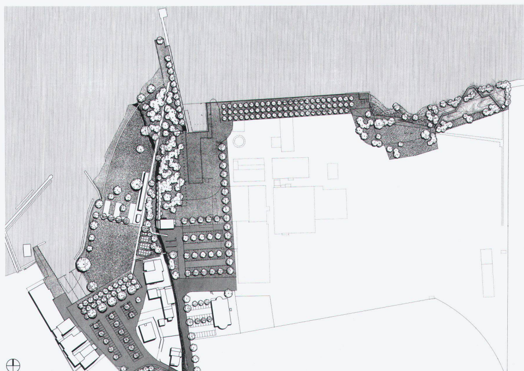
Situationsplan des Gesamtprojektes

Dank einer fortschrittlichen Gemeindepolitik wird das «natürliche» Seeufer mit erheblichem Aufwand öffentlich gemacht. Die verschiedenen neuen Funktionen wie Festplatz, Baden, Landesteg, Promenade, Parking, Biotop werden geschickt in eine rationale Gestalt überführt. Die Einheitlichkeit von Sprache und Mitteln bewirkt eine grosse Bestimmtheit bei gleichzeitiger klarer Abgrenzung gegen die Natur. Wird auf dem angrenzenden Areal Steinfabrik die projektierte Überbauung realisiert und das Ende des Spazierweges mit dem Ort verbunden, so wird die Uferanlage, wie vorgesehen, ein Teil des Dorfes sein. B.J./I.N.