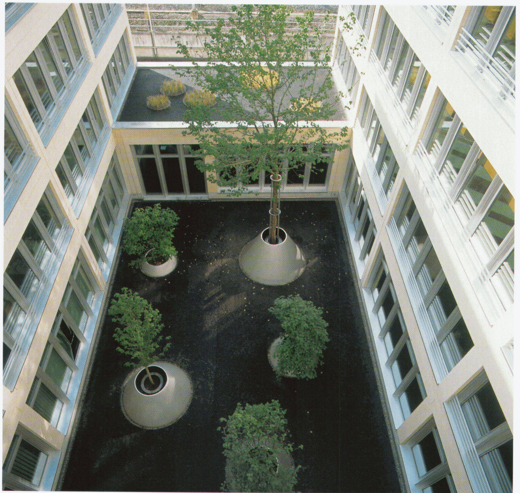
Aabachstrasse 1, Zug

Landschaftsarchitekt Toni Raymann, Dübendorf