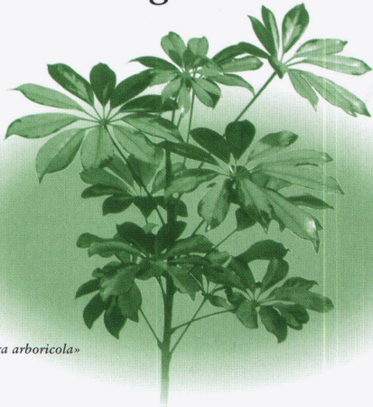
z.B. «Schefflera arboricola»