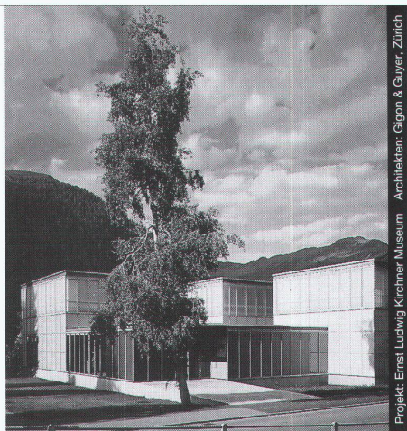
Projekt: Ernst Ludwig Kirchener Museum Architekten: Gison & Guyer, Zürich

Ästhetik, Wirtschaftlichkeit und bauphysikalische Anforderungen in Einklang zu bringen, ist das Ergebnis ausgereifter Konstruktionen. Qualitätsbewusstsein und partnerschaftliche Zusammenarbeit sind nur einige der Voraussetzungen für ein gutes Gelingen in dieser vielfältigen Branche.