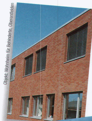
Objekt: Wohnheim für Behinderte, Oberentfelden