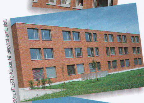
Stein: KELESTO-Klinker, NF ziegelrot-bunt, glatt