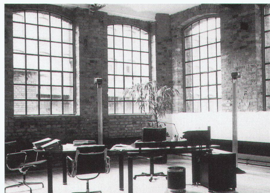
Hannover, Laves-Haus: Neue Büro- und Gewerberäume in der ehemaligen Schraubenfabrik Heyne, Offenbach

Hannover, Laves-Haus «Umnutzung im Bestand – neue Zwecke für alte Gebäude» bis 25.5. Tel. 0049 511 280 96 0