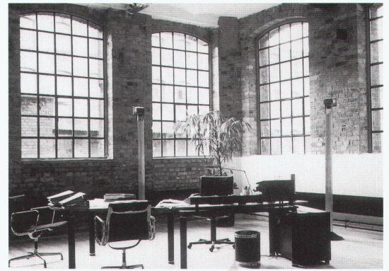
Hannover, Laves-Haus: Neue Büro- und Gewerberäume in der ehemaligen Schraubenfabrik Heyne, Offenbach

«Umnutzung im Bestand – neue Zwecke für alte Gebäude» bis 25.5. Tel. 0049 511 280 96 0