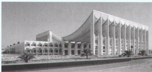
ETH-Hönggerberg, Zürich: Jørn Utzon: Parlamentsgebäude in Kuwait, 1972–1984.

Eau et Paysage Henri Bava, Michel Hoessler, Olivier Philippe: l'Agence TER bis 30.4. Tel. 0033 1 49 96 64 00 http://perso.club-internet.fr/tha