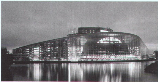
La Galerie d'Architecture, Paris: Architecture Studio, Parlement Européen, Strasbourg

Paris, La Galerie d'Architecture Architecture Studio «Genèse d'un projet: Le Parlement européen à Strasbourg» 10.3.–2.4. Tel. 0033 1 49 96 64 00