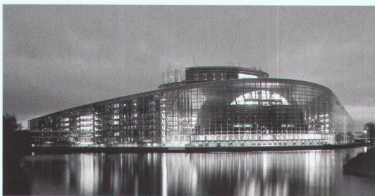
La Galerie d'Architecture, Paris: Architecture Studio, Parlement Européen, Strasbourg

Paris, La Galerie d'Architecture Architecture Studio «Genèse d'un projet: Le Parlement européen à Strasbourg» 10.3.–2.4. Tel. 0033 1 49 96 64 00