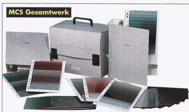
MCS Gesamtwerk Das MCS Gesamtwerk mit rund 300 Métallisé- und Eisenglimmer-Farbtönen. In 2 Ordnern mit A6-Farbkarten. Schutzgebühr CHF 259.-.

MCS auch als Farbfächer inkl. RAL und DB-Eisenglimmer-Farbtönen. Schutzgebühr CHF 20.-.