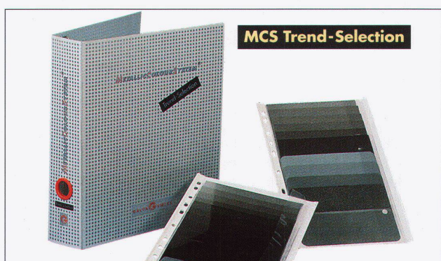
MCS Trend-Selection Trend-Selection, ein Auszug aus dem MCS Gesamtwerk mit rund 45 der begehrtesten Anthrazit- und Patina-Farbtönen. Schutzgebühr CHF 69.-.

MCS auch als Farbfächer inkl. RAL und DB-Eisenglimmer-Farbtönen. Schutzgebühr CHF 20.-.