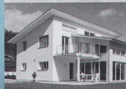
EFH: Renggli Hausbau AG, Schötz