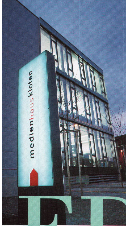
Medienhaus Kloten: 8 Unternehmen vernetzt unter einem Dach. Installation: E.Schibli AG, Kloten