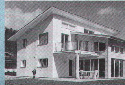
EFH: Renggli Hausbau AG, Schötz