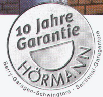
Hörmann Berry-Tor mit Kassettenfüllung