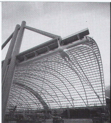
Projekt: Postausstation Chur Halendach Architekten: Brossi Chur & Obrist St. Moritz

Stahl-Glas-Konstruktionen in architektonisch perfekter Vollendung verwirklichen wir mit innovativen Ideen und höchsten Anforderungen an Materialien und Ausführung.