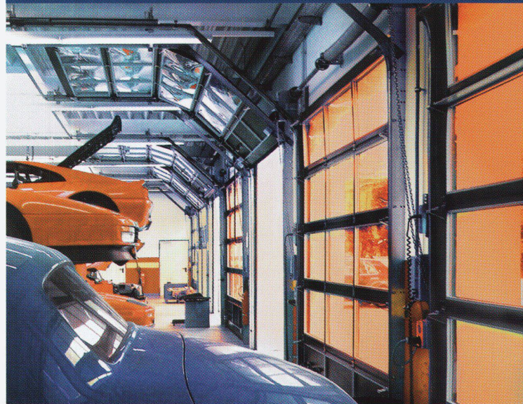
Hörmann Aluminium-Sectionaltore mit Antrieb und Steuerung