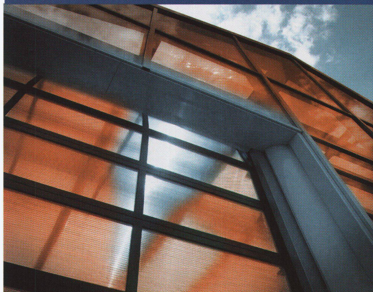
Hörmann Sectional-Industrietor APU